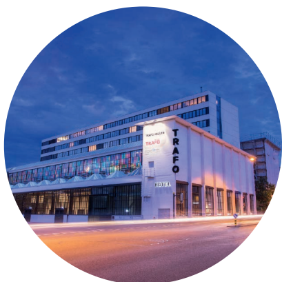
TRAFÖ HOTEL, BADEN