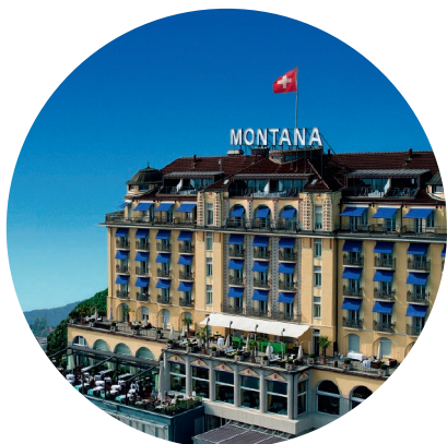
ART DECO HOTEL MONTANA, LUZERN