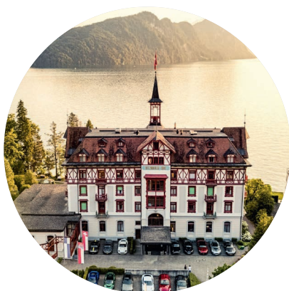
HOTEL VITZNAUERHOF, VITZNAU