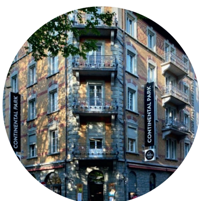
HOTEL CONTINENTAL PARK, LUZERN