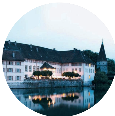
ALTES SPITAL, SOLOTHURN