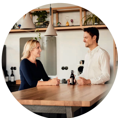
MEMOX, EUROPAALLEE, ZÜRICH