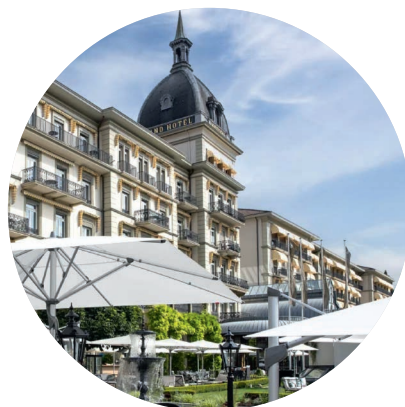
VICTORIA-JUNGFRAU GRAND HOTEL & SPA, INTERLAKEN